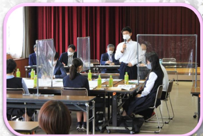
あま市総合計画策定市民会議